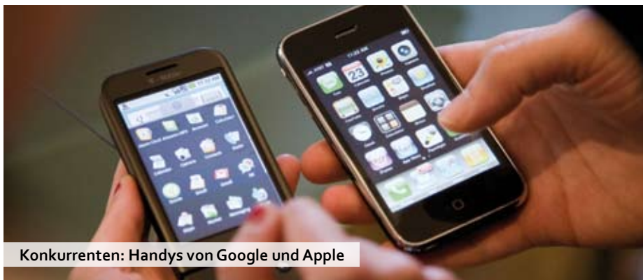
Konkurrenten: Handys von Google und Apple