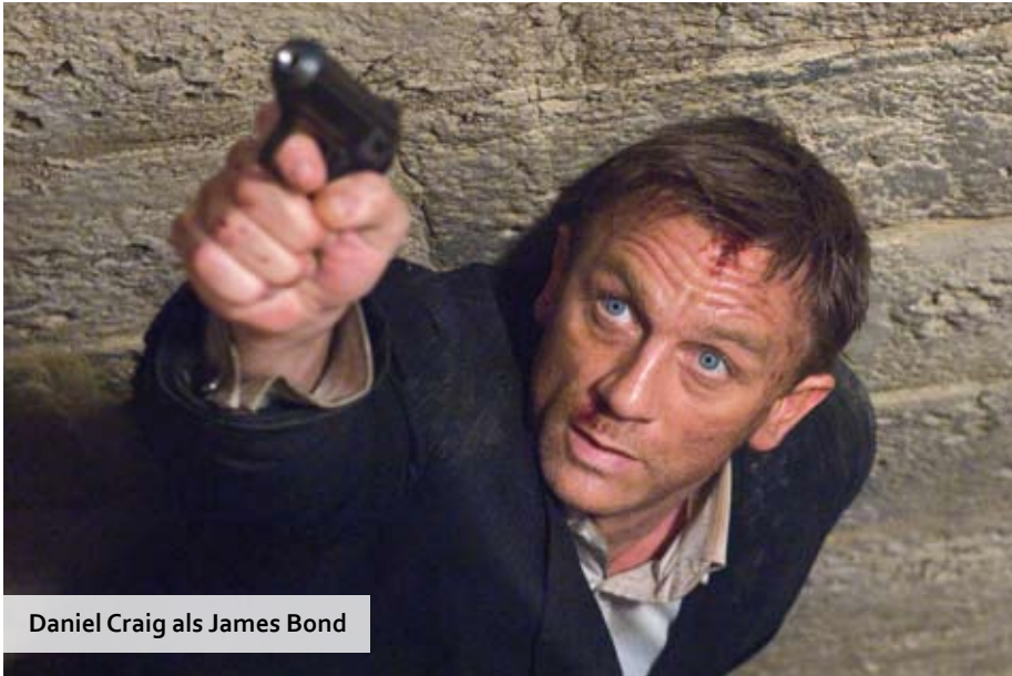
Daniel Craig als James Bond

Hollywood setzt in der Krise auf James Bond und 3D-Animationen