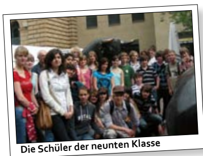
Die Schüler der neunten Klasse

Auktion von Filmplakaten. Von den Erlösen des Basars konnte ein Auto für das Kinderhospiz finanziert werden – ein schöner Erfolg für unsere Schülerfirma.