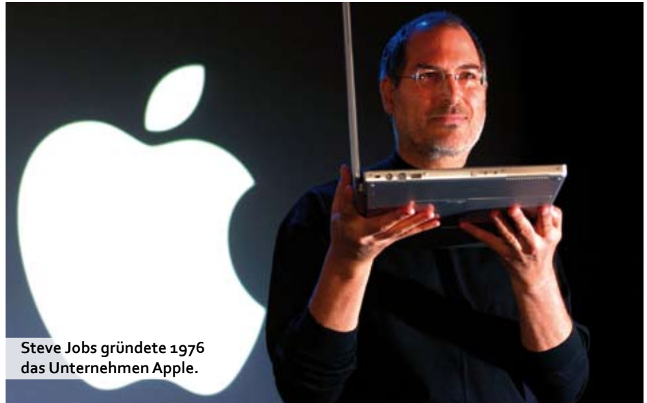
Steve Jobs gründete 1976 das Unternehmen Apple.

Nach einem Streit verließ Steve Jobs 1985 das Unternehmen. Ein Jahr später gründete er das Filmstudio „Pixar“, mit dem er Kassenschlager wie „Toy Story“ und „Findet Nemo“ landete. Als Apple Verluste machte, folgte Jobs 1997 dem