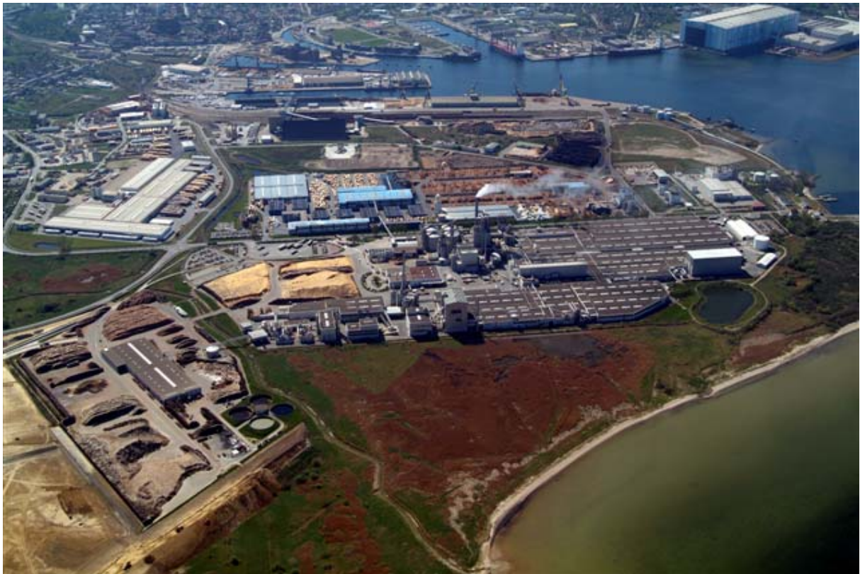
Holzverarbeitende Industrie im Haffeld- Nord (Wismar)